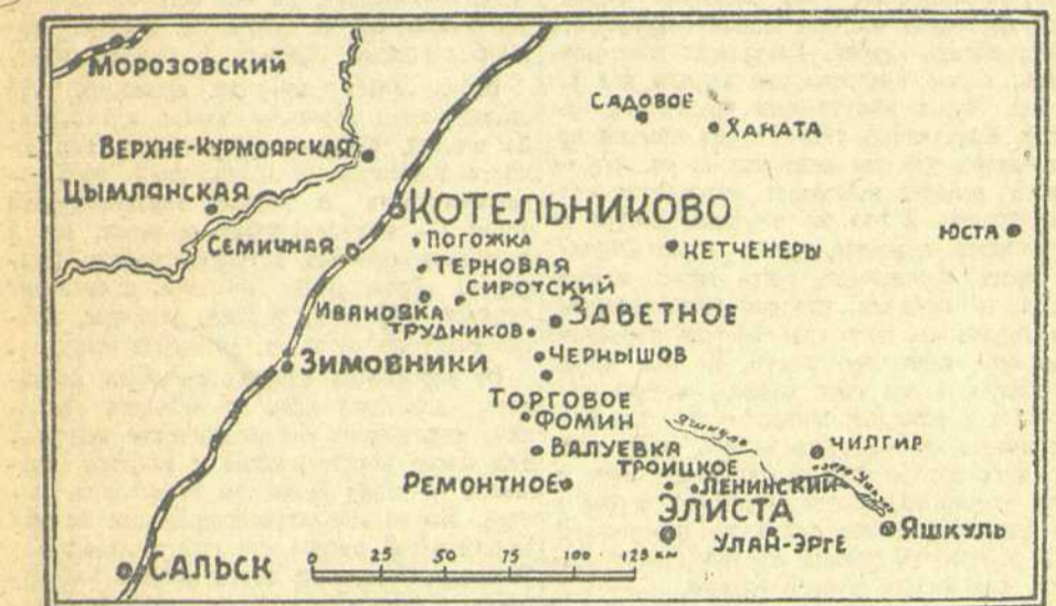
за одним начали предпринимать контратаки.

В одном районе противник устроил засаду. Кружная группа автоматчиков и несколько артиллерийских орудий готовили фланговый удар наступающим частям. Но засада своевременно была обнаружена нашими разведчиками. Когда это стало известно, артиллерия, еще до подхода наступающей пехоты, разгромила и рассеяла неприятельскую засаду. На месте ее осталось большое количество трупов и артиллерийские орудия. Уничтожив засаду, на которую противник, судя по всему, возлагал большие надежды, наши части быстрее