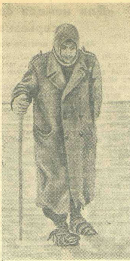
НА СРЕДНЕМ ДОНУ. «Завоеватель!»

В подвиге у братской могилы состоялся траурный митинг, посвященный открытию памятника. В нем приняли участие боевые товарищи погибших, а также трудящиеся города Калача. На митингу было возложено много венков. Салюту, прощали церемониальным маршем гвардейцы-танкисты, готовые к новым жестоким боям до полной победы над немецкими захватчиками.